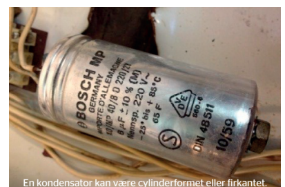
En kondensator kan være cylinderformet eller firkantet.

PCB står for Poly-Chlorede Biphényler. PCB kan overføres til mennesker gennem kosten, ved indånding og ved hudkontakt. Fødevarer er den største kilde til PCB i kroppen for befolkningen som helhed. PCB anses ikke for at være akut giftigt, men hvis man udsættes for meget PCB i mange år, kan det give helbredsproblemer. PCB er af WHO klassificeret som kræftfremkaldende hos mennesker. PCB, som ophobes i kroppen, kan blandt andet virke hormonforstyrrende, skade de indre organer, påvirke immun- og nervesystemet og øge risikoen for diabetes.