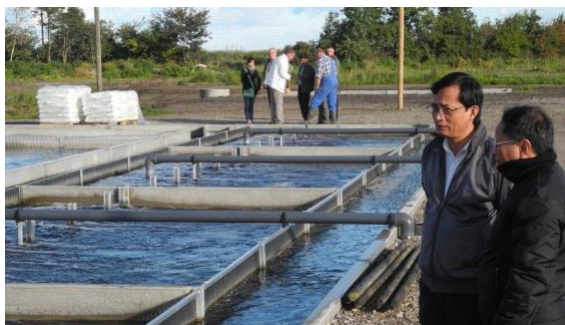
Foto: Dambrug i Vietnam